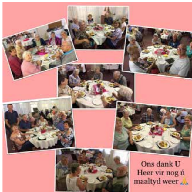
Ons dank U Heer vir nog 'n maaltyd weer

Dinsdag besoek ons The Cradle of Life. Geleë op 'n Ametis kristal rif. Die eksotiese kat familie word hier in veilige bewaring versorg. Wit leeus, Bengaalse tiere, Puma bergleue, en ander eksotiese katte. Big boy en Balula, die twee wit leeus het almal met groot verwondering aanskou. Die vreemdste name is aan die diere gegee soos Cleopatra die "Spotted Jaguar" en die silwer jakkalsie, heet Jakkalas. Interessant dat Whoopie die Hyena ook sorteer onder die kat familie. Woensdag vaar ons op 'n Veerboot vlot op die Vygeboom dam. Die Bromberg en heuwels omring ons! Bromberg vernoem na die gerammel wat glo soms te hoor is agv die